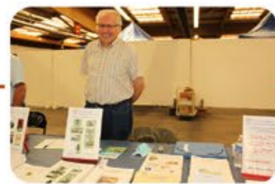
Patrice Samson pour la Société Historique