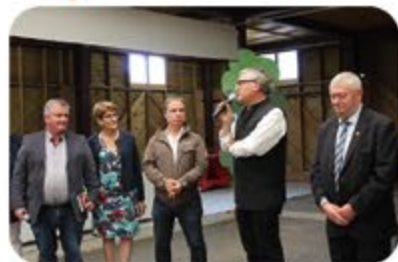
Michel Onfray défend « la culture dans le monde rural » lors de l'inauguration