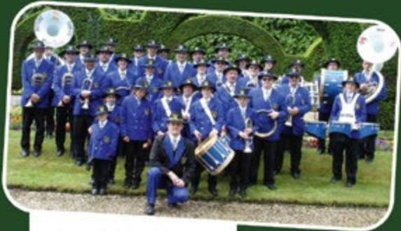
Les diables bleus